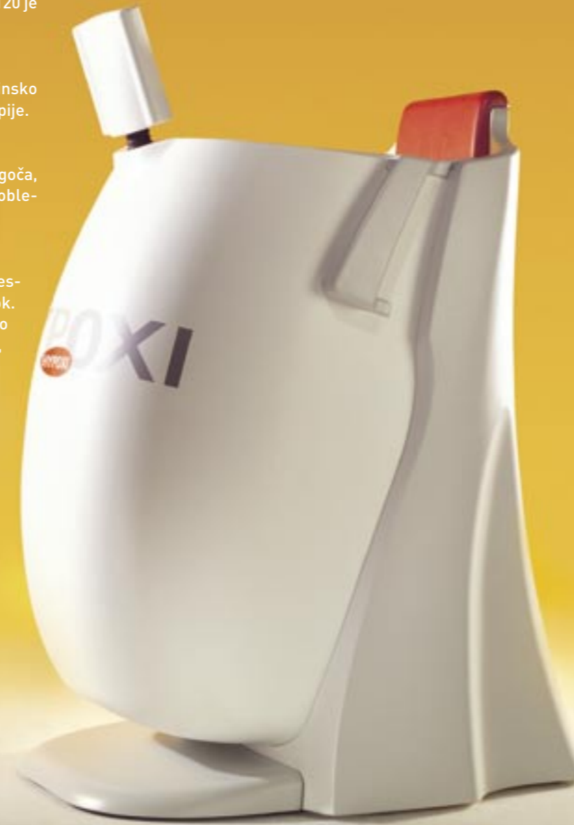
Svetovna premiera: Hypoxi Trainer S120

Izmenjava nadtlačenja in podtlaka poteka tekom celotnega postopka.